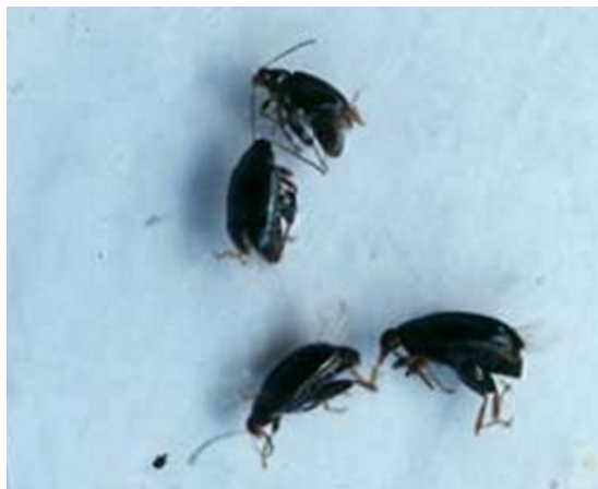
Billede 2. Rapsjordlopper i fangbakke.