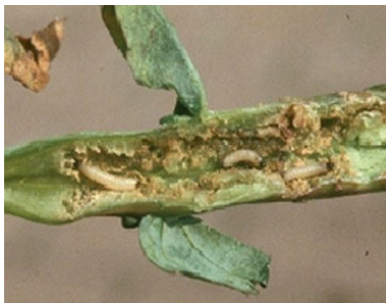
Billede 3. Larveangreb i rapsstængel om foråret.

Landmænd opfordres til at sætte fangbakker op i deres mark. Det er dog vigtigt at følge flyvningen helt hen til omkring 1. november. To gule fangbakker dækker max. en 10 ha stor mark. Fangbakker kan købes hos Frøsalget, tlf.: 7538 1744. Disse fangbakker er runde og koster 65,- kr. pr. stk. ekskl. moms. Fangbakkerne er dog ikke 100 procent sikre. Fra praksis er modtaget nogle meldinger om mere udbredte angreb trods relativt lave fangster i fangbakkerne. Har landmanden ikke fangbakker i egen mark, må behovet fastlægges ud fra fangsterne i registreringsnettet.