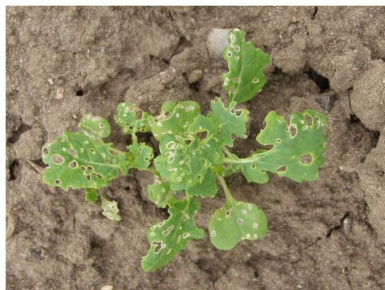
Billede 1. Rapsjordløpper har angrebet bladene.

Gnav af rapsjordløpper kan nogle gange forveksles med gnav af agersnegle. Bladgnav af rapsjordløpper er små runde huller inde i bladpladen, hvorimod bladgnav fra snegle er mere flossede og oftest ude i kanten.